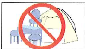
テント、イス等は禁止