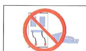
斜路内等での給油禁止