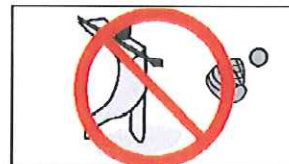
ゴルフ、キャッチボール等球技禁止