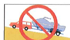
斜路等に放置禁止、白線内に駐車