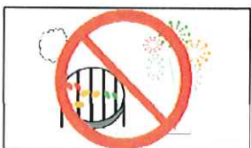
花火、バーベキュー等禁止