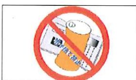
ゴミの散乱、ポイ捨て禁止